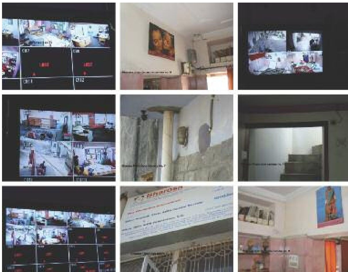
受前线组织资助的人权组织的闭路电视系统

2.1.7 把组织安全计划传达给需要按计划行事的成员——最好是全部工作人员。 尽管你可能以文献的形式传播，但是最好能够面对面地展示它，给予每个人讨论组织安全计划和安全性的重要性的机会。