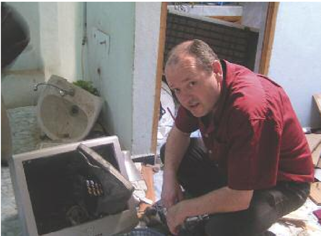
警察查抄的结果，西撒哈拉

所以，例如说，如果你的办公室所在地容易被盗和受到物理攻击，创建一个名为“办公室安全风险”的目录（但是要写一句话来解释该目录包括下列哪些情况，这样的话那些真正的风险就不会因为时间的推移而被掩盖掉）。