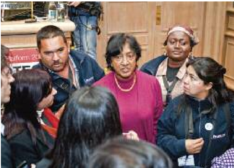
都柏林站的维权卫士们与联合国人权事务高级专员那维·皮莱 (NAVIPILLAY) 建立联系

反面是一个简单的示例——这并不是一个针对你个人情况的计划。你可以看更多相关案例来思考附录中的内容。但是，鉴于你的能力和弱势等具体个性，你是最知道什么最有效的人。