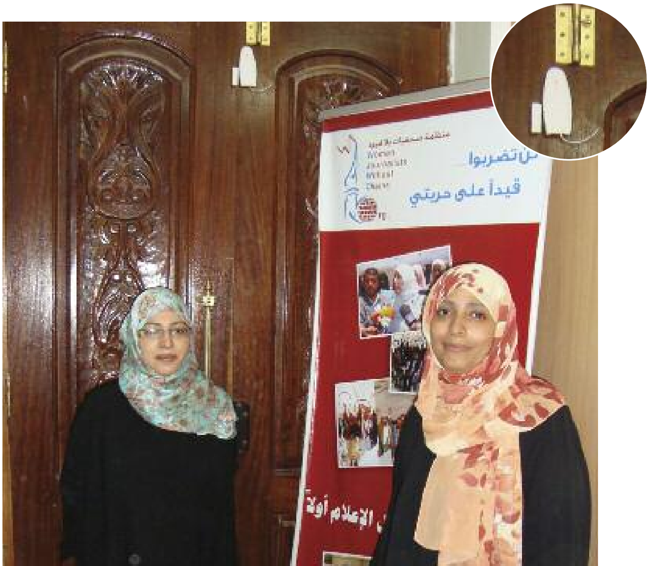
也门的无锁链女记者人权组织收到了一笔来自前线组织的拨款，用来安装了办公室的警报系统

注：记住，所有关于你开始建立自己安全计划的书页都是可以从这本手册中剪裁下来的，你可以把它们放在一起，保存在一个安全的地方。