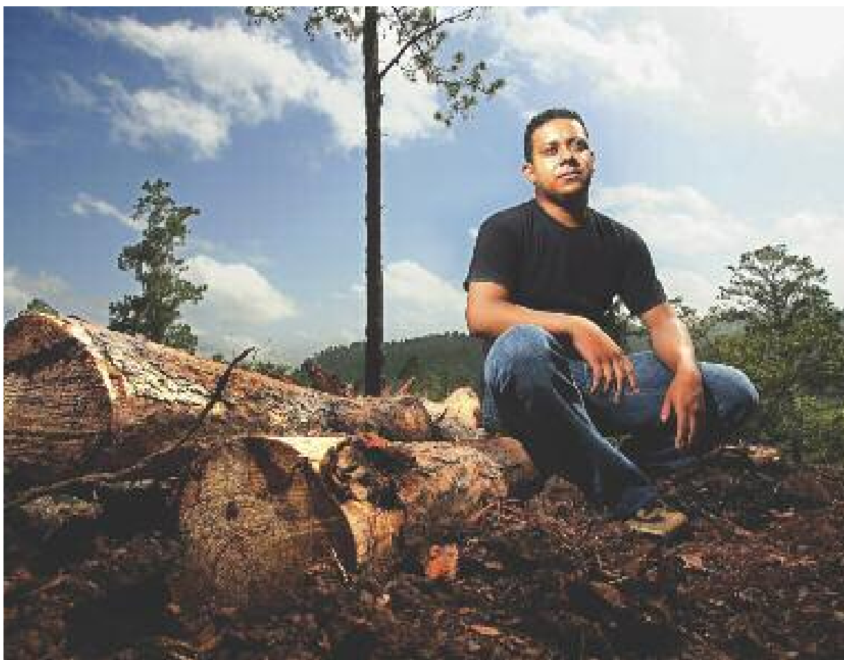
RENE GRADIS, 洪都拉斯的环境活动家，在两次暗杀攻击中幸免于难