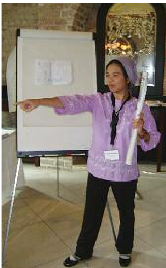
图：来自菲律宾的DOM-AN 在进行接到和应对死亡威胁的角色扮演练习

“如果你继续进行这种类型的工作，那么明年你的机构将不会被（合法地）注册” “我们将会绑架并强奸你的女儿”