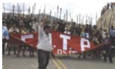
Члены сообщества Багуа проводят демонстрацию в защиту земельных прав коренного населения, Перу

Целью настоящего примера не является создание идеального плана выхода из ситуации, которая содержит угрозу. Безусловно, принятое решение подходит только для данной конкретной ситуации и приведено здесь, чтобы