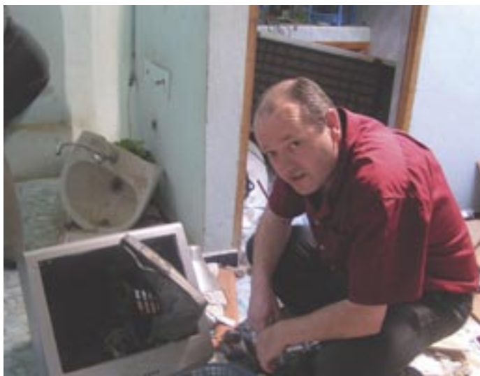
Последствия полицейского рейда, Западная Сахара

2.1.2 Определение приоритетности рисков с использованием модели риска. Для каждого риска, попытайтесь прийти к общему соглашению какова его вероятность, и какими будут его возможные