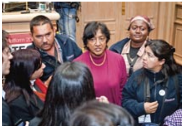
Правозащитники на Дублинской Платформе общаются с Нави Пиллай, Верховным комиссаром ООН по правам человека

Если вы до сих пор этого не сделали, составьте план для каждого риска на модели риска (Табл. 3.5), основываясь на степени возможности их возникновения (их вероятности), и их воздействии на вас, если они действительно произойдут. В этой работе вы будете опираться на свой опыт и знание политической ситуации. Это субъективная оценка.