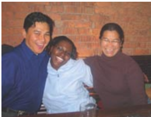
Участники семинара расслабляются после его окончания

Организации, где работают правозащитники, должны