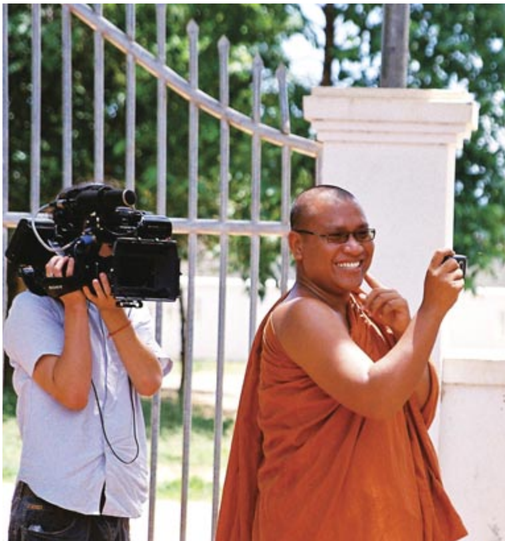
Съемка документального фильма о том, как Досточтимый Соват Луон (справа) помогал правозащитникам привлечь внимание общественности и обеспечить защиту