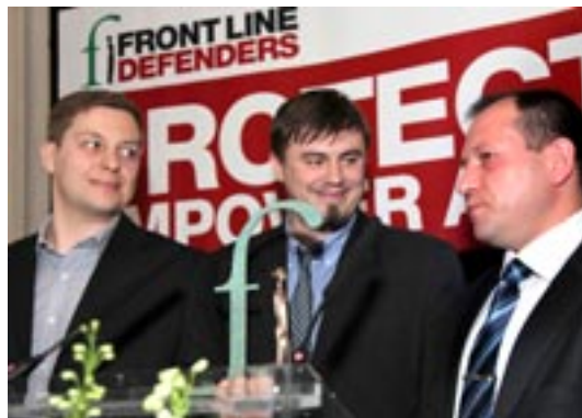
Сводная мобильная группа

“Сводная Мобильная Группа проводит работу в Чеченской Республике с 2009 г. Группа состоит из членов разных правозащитных организаций России; она была создана с целью получения достоверной и проверенной информации о нарушениях прав человека в Чеченской Республике. Помимо этого в задачи группы входит выявление причин неэффективности расследований дел о пытках и похищениях в Чечне, проводимых следственными органами.