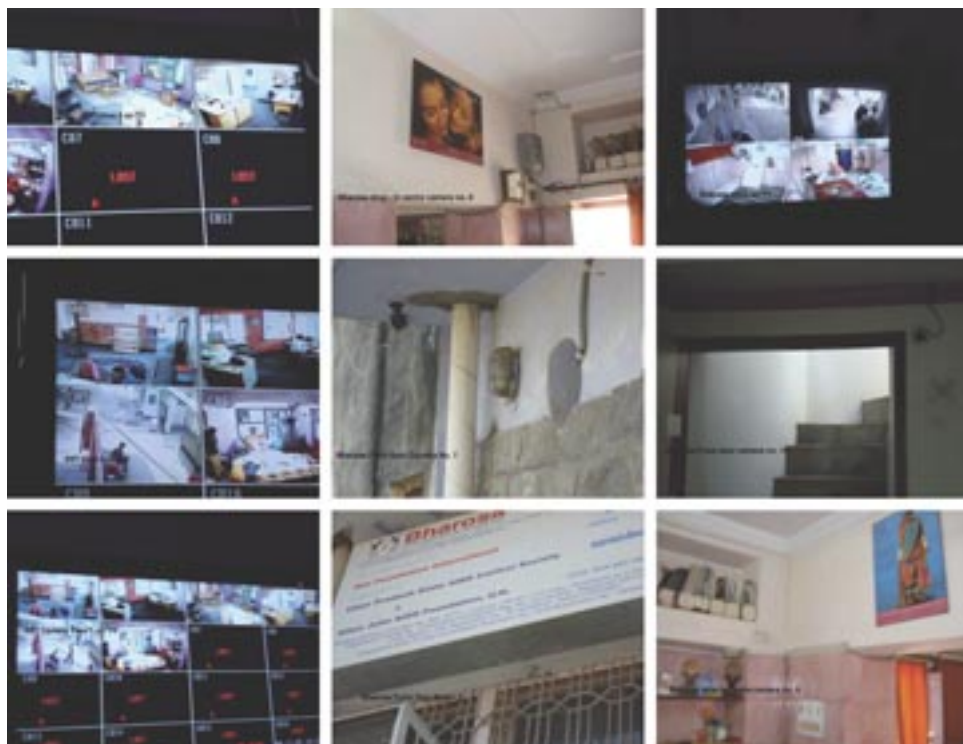
Системы скрытого видеонаблюдения для правозащитных организаций, предоставляемые организацией Front Line Defenders

2.1.6 Назначьте ответственных за составление предварительного плана для каждого из оставшихся рисков из числа тех участников, кто лучше подходит для