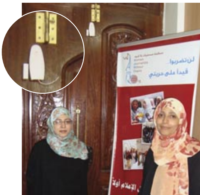
«Женщины-журналисты без цепей» в Йемене получили грант от Front Line Defenders на установку системы аварийной сигнализации в офисе

Примечание: Помните, что все листы, на которых вы начнете создавать свой собственный план безопасности, можно вырвать из настоящего Практического учебного пособия и хранить в надежном месте.