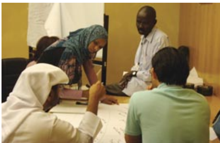
Участники тренинга по безопасности вместе изучают, какие лица могут оказать влияние на их безопасность

«Здесь очень много вооруженных групп! Правозащитник, который работает в этом районе, должен уметь различать каждый тип групп, их расположение, внешний вид, оружие и методы. Если вы этого не умеете и встречаете вооруженного человека, вы не будете знать, какая стратегия защиты является лучшей в данной ситуации. Если вооруженные люди являются грабителями, я знаю, что они только хотят отобрать мою машину, а меня отпустят. Если они наркоторговцы,