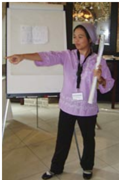
Дом-эн из Филиппин в ролевой игре о получении угрозы жизни и реагировании на нее

«После убийства нашего директора, мне начали угрожать. В моей организации создали целую команду для работы над способами уменьшения вероятности угрозы. Одна команда искала способы влияния на начальника полиции и министра безопасности. Другая команда сконцентрировала свое внимание на получении поддержки со стороны посольств, в особенности посольств, предоставляющих двустороннюю помощь системам правосудия и безопасности. Третья команда работала над улучшением моей защиты дома и во время поездок. Это был действительно организационный подход». Правозащитник, Азия