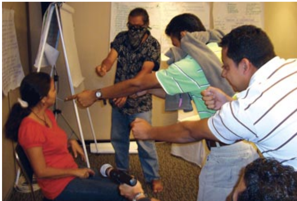
Инсценировка нападения вооруженных мужчин на правозащитницу, иллюстрирующая план безопасности в действии