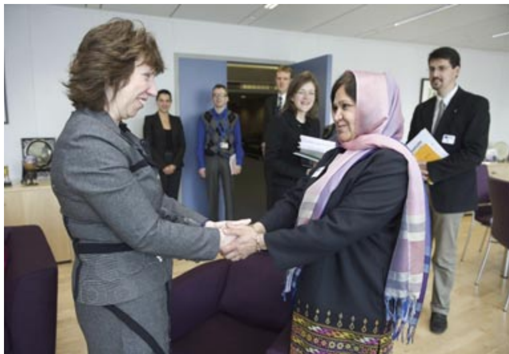
Верховный представитель ЕС, Кэтрин Эштон приветствует Д-ра Сораю Собранг, лауреата Премии Front Line Defenders 2010 года