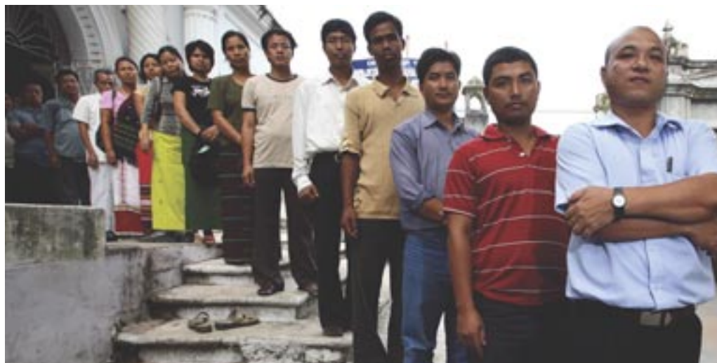
Акция солидарности. Члены правозащитной организации народов Борок, Трипура, Индия

Целью этой Главы Практического пособия Front Line Defenders не является замещение терапии или другой профессиональной помощи, которая необходима или доступна.