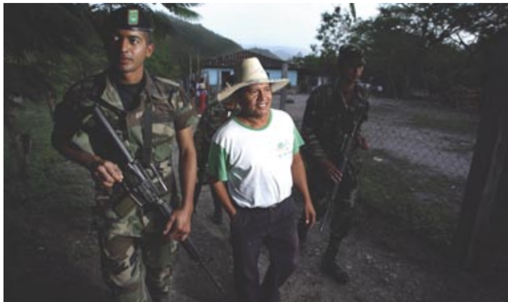
Отец Томайо, Гондурас

Как оценить вероятность? Данный процесс - субъективный, но вы будете основывать свой ответ на истории репрессий и действий, предпринятых против правозащитников. Точно так же является субъективной ваша оценка воздействия, но вы должны принимать во внимание вред, который будет причинен вам и вашей организации, помня при этом, что некоторые правозащитники, например, женщины и ЛГБТИ-активисты, более подвержены риску, потому что они более уязвимы в некоторых ситуациях.