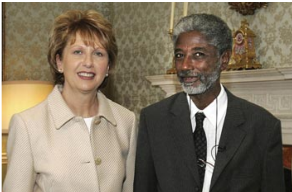
Доктор Мудави, Судан, лауреат премии Front Line Defenders в 2005 году, вместе с президентом Ирландии Мэри Макализ.

«Управление рисками нарушения системы безопасности – подход НПО» (на английском языке) Interaction Security Advisory Group http://www.eisf.eu/resources/item.asp?d=2551