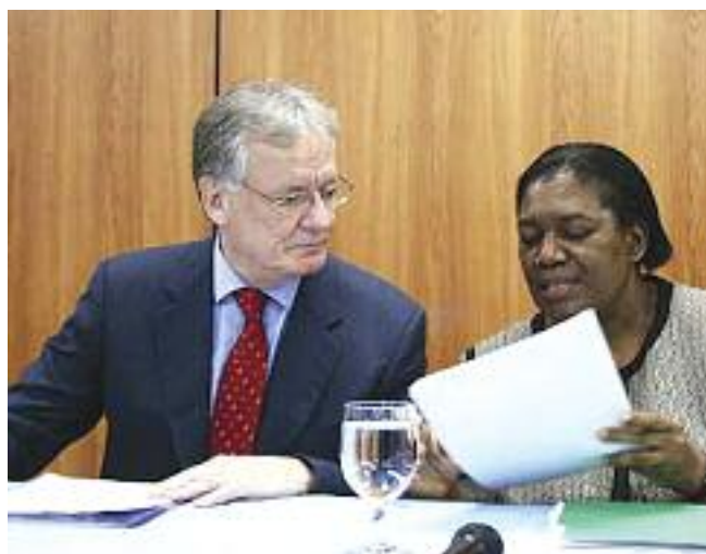
Маргарет Секэггья Специальный докладчик ООН по вопросу о положении правозащитников призывает к созданию защитного механизма для правозащитников в Гондурасе февраль 2012