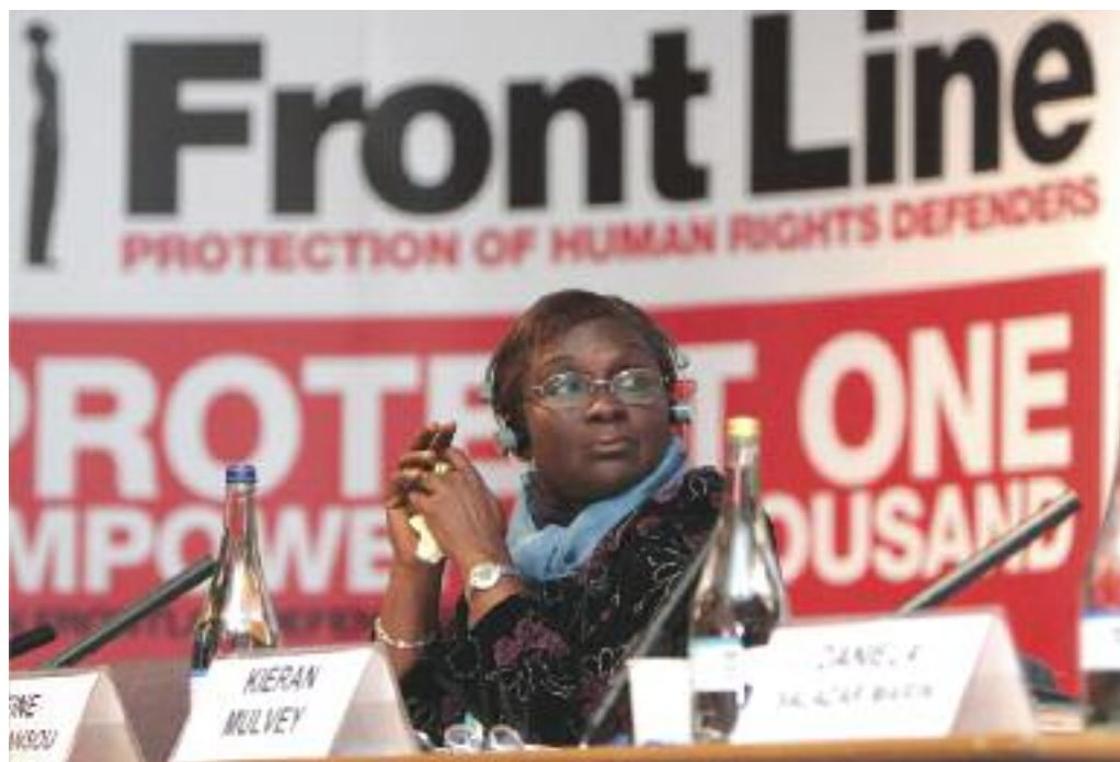
Рейне Алапини–Гансу, Специальный докладчик по вопросу о положении правозащитников в Африке на конференции «Дублинская Платформа 2011»