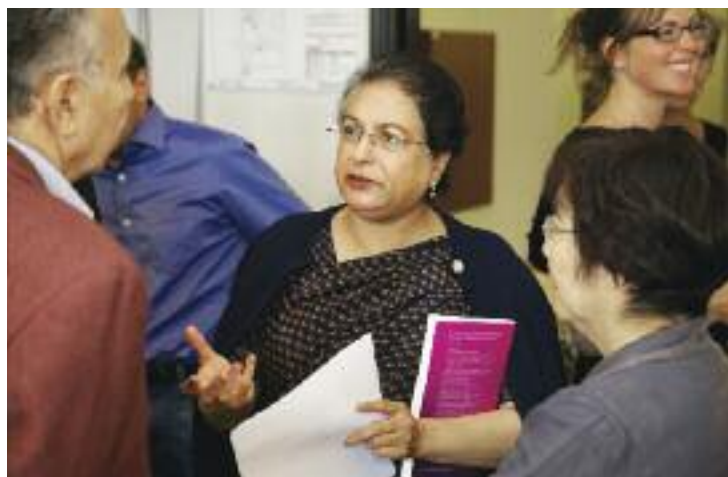
Бывший Специальный Представитель Генерального Секретаря ООН по правозащитникам Хина Джилани на семинаре Front Line Defenders в Норвегии, 2010г.

Альберто Брунори, Представитель УВКПЧ/Гватемала