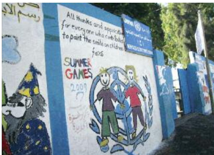
Здание Агентства ООН по оказанию помощи и организаци и работ Газа