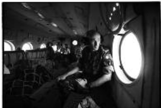
Ирландский миротворец ООН подполковник Конор Бурк Западная Сахара