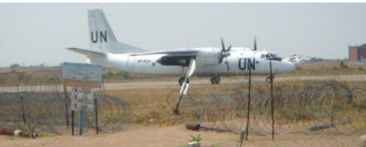
Самолет ООН, ДРК

защиты отдельных лиц, и её мандат в качестве независимой надгосударственной организации не предоставляет ей эффективной власти для защиты индивидуумов от действий государства (или предъявления требований к государству по защите своих граждан от насилия со стороны третьих лиц). Тем не менее, мандаты нескольких агентств ООН призывают их защищать людей, находящихся под угрозой. Как мы видели, ЮНИСЕФ обязан защищать детей, МОТ занимается трудящимися и рабочими, а УВКБ – беженцами и насильно перемещенными лицами, и т.д.