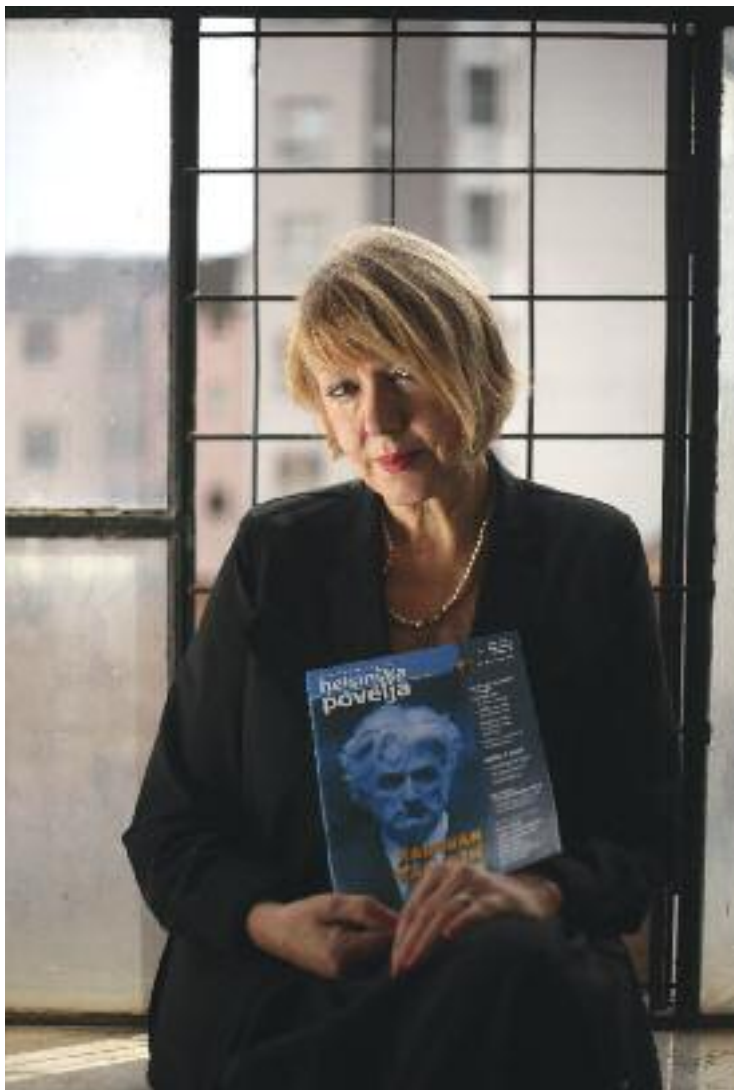
Соня Бисерко, Президент Хельсинского Комитета по правам человека в Сербии.