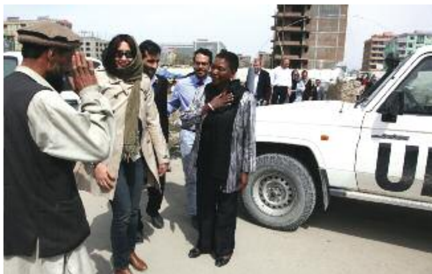
Валерия Амос, Заместитель Генерального Секретаря ООН (на переднем плане справа) посетила лагерь беженцев в Кабуле, в районе Парван Се, в ходе своей поездки в Афганистан в мае 2012.

Это проблема особенно ощущается в больших странах, где еще нет стойких традиций соблюдения прав человека, где права человека нарушаются грубо и часто, и где правозащитники находятся в особенно опасных условиях. Китай и Россия являют собой наглядные примеры, хотя Индия, Южная Африка и Бразилия (каждая по-своему) тоже проблематичны. Саудовская Аравия также успешно противостоит международной критике.