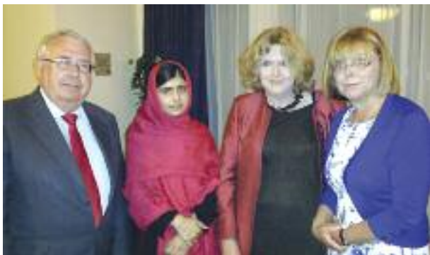
Слева направо: Министр иностранных дел и торговли Ирландии Джо Костелло; Малала Юсафзаи из Пакистана; Мэри Лолор, директор Front Line Defenders; Эмер Костелло, депутат Европейского парламента.

суждают этот вопрос. Затем, 2 мая, было сделано заявление на местном уровне, в котором ЕС выразил глубокую озабоченность данным инцидентом и призвал к тщательному расследованию. 10 В убийстве был обвинен офицер военной полиции, тоже погибший во время этого инцидента. В сентябре 2012 г. расследование было закрыто.