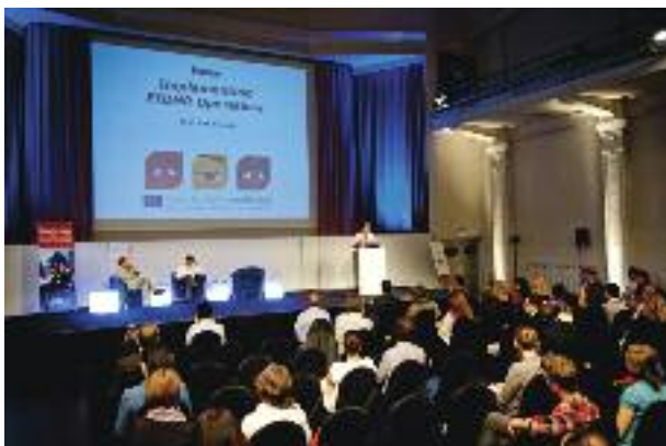
Форум Европейского инструмента содействию демократии и правам человека, Брюссель, 2011 год.