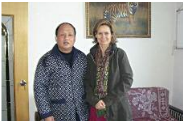
Депутат Европейского парламента Хельга Трупель на встрече с правозащитником Джен Энчхонгом в Шанхае.

возможных действий ЕС и обеспечения безопасности членов «Ампаро». Front Line Defenders также обсуждала этот вопрос с Делегацией ЕС 26 октября 2012 г. 1 ноября было сделано местное заявление ЕС, призывающее таджикские власти пересмотреть решение о закрытии организации и восстановить лицензию «Ампаро», в соответствии с обязательствами Таджикистана содействовать свободе собраний. 11 В том же месяце во время своего визита в страну по просьбе Делегации ЕС, а также некоторых стран-участниц ВП/ВП (Верховный представитель Союза по иностранным делам и политике безопасности / Заместитель Председателя Европейской Комиссии) подняла этот вопрос на встрече с Президентом Таджикистана. В публичном заявлении по итогам встречи была подчеркнута важность деятельности «Ампаро». 12 Далее в декабре на заседании Постоянного совета Организации по Безопасности и Сотрудничеству в Европе (ОБСЕ) Евросоюз выразил озабоченность относительно предстоящего закрытия организации. 13