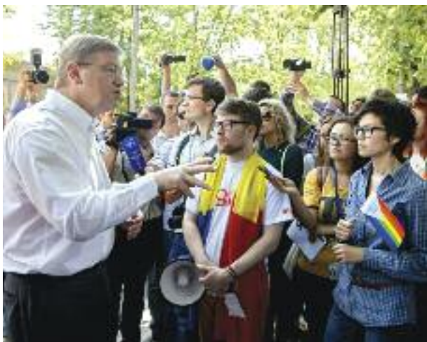
Комиссар ЕС Штефан Фуле на ЛГБТ демонстрации в Молдове.