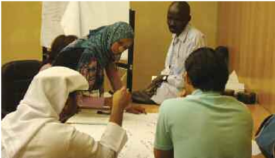
Des participants à un atelier de formation sur l'analyse des acteurs

Dans ce chapitre, nous allons voir en quoi l'analyse de l'environnement peut être utile, et avec qui et quand la faire. Nous présentons deux outils pour analyser l'environnement – Questions pour l'Analyse de l'Environnement et une Analyse des Acteurs. L'annexe 1 introduit aussi un outil plus simple, l'analyse SWOT, ou analyse MOFF – Menaces, Opportunités, Forces et Faiblesses.