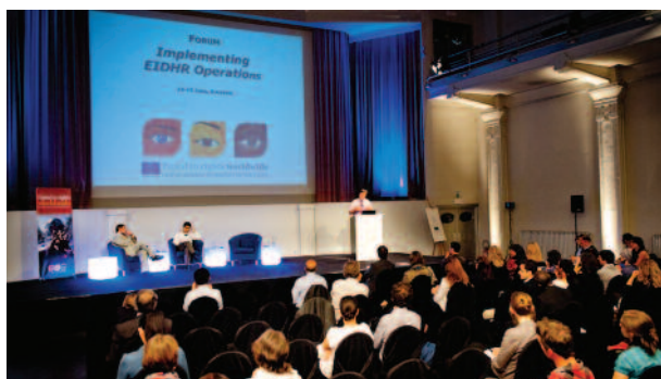
Foro del Instrumento Europeo para la Democracia y Derechos Humanos (EIDHR), Bruselas 2011.

Los/as DDH deben buscar obtener financiamiento de emergencia para medidas de protección de parte de las misiones de la UE o de la Comisión Europea en Bruselas. Los/as DDH también deben invertir en solicitudes de financiamiento. Si bien los procedimientos para acceder a un financiamiento de la UE para su proyecto pueden ser complicados y llevan mucho tiempo, no solo sirve para acceder a recursos financieros valiosos sino que, además, se crea una base sobre la cual construir una relación con las misiones de la UE. A través de una relación de financiamiento, la UE puede conocer la situación y la tarea que desarrollan los/as DDH. Asimismo, es más probable que las misiones de la UE actúen para proteger a los/as DDH cuyas actividades están financiando.