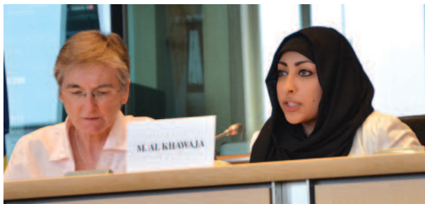
Maryam Al_Khawaja de Bahrein participa en un evento el Parlamento Europeo para celebrar el primer aniversario del Marco Estratégico de la UE sobre Derechos Humanos, 2013