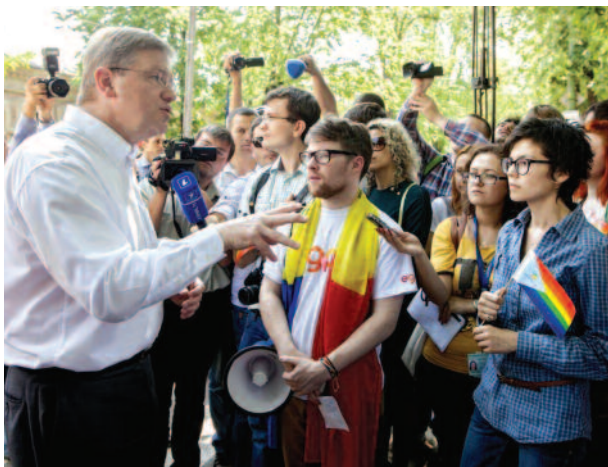
El Comisario Europeo Ștefan Füle asiste a una concentración de LGTB en Moldavia